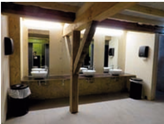
WC-Anlage im Obergeschoss