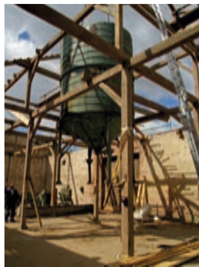
Silo Rückbau mit Kraneinsatz