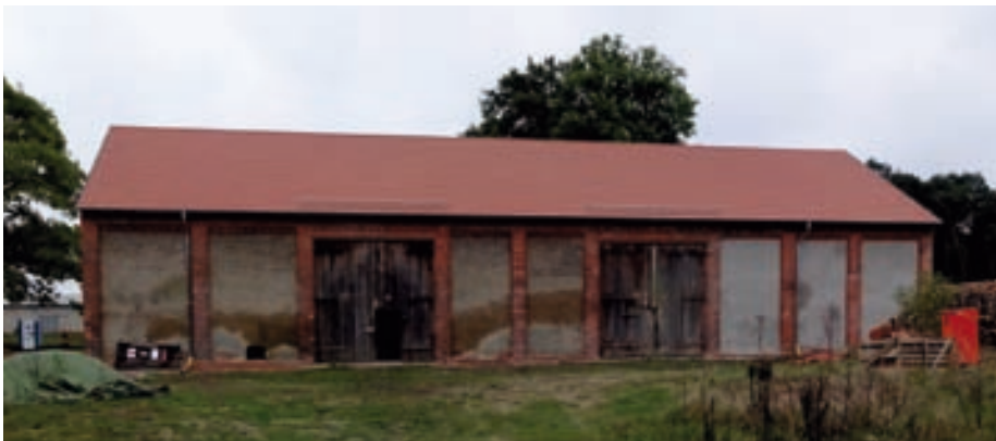
Fertigstellung Dach und verputzte bzw. ausgebesserte Wandflächen