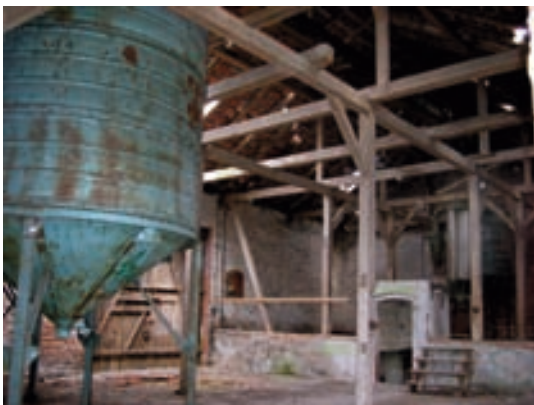
Blick Richtung Bühne

Trotz großer Schäden im Dach und in der Dachkonstruktion war die große Siloscheune noch das am besten erhaltene Gebäude der Hofanlage. Die noch vorhandenen Silos schufen zudem eine ganz besondere Atmosphäre. Bereits von außen sichtbar war, dass die Scheune im westlichen Bereich erhöht wurde, um den Silos Platz zu bieten. Im Rahmen des Rückbaus sollte die ursprüngliche Kubatur wieder hergestellt werden. Bereits von den ersten konzeptionellen Überlegungen an war auch klar, möglichst viel offenen Raum innerhalb der Scheune zu erhalten. Selbst die Bühne war bereits vorhanden. Die neuen Funktionen wie die Sanitäranlagen und die Aufwärmküche sollten als neue Zutat klar erkennbar eingestellt werden, also ALT trifft NEU. Dafür haben wir uns für vorproduzierte Holztafeln entschieden. Bei diesen sogenannten CLT-Platten (Cross-Laminated-Timber) handelt es sich um groß dimensioniertes Brettsperrholz, sprich Vollholzplatten.