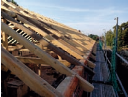
Dachstuhl mit Verwendung der restlichen Bestandssparren