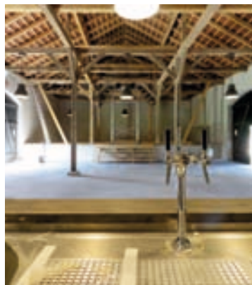
Blick vom Tresen zur Bühne