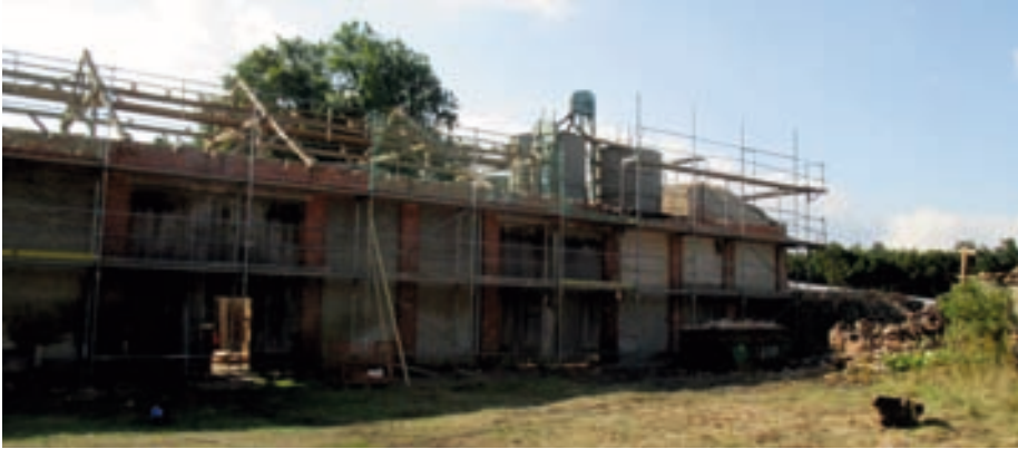
Silo Getreidespeicher mit freigelegter Dachstruktur