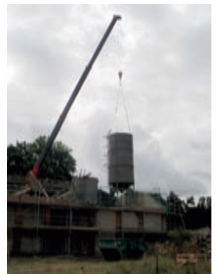
Silo Rückbau mit Kraneinsatz