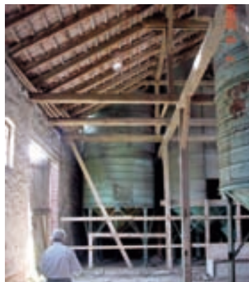
Blick Richtung Bar/Küche/WC