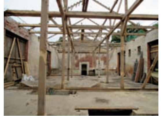
Scheune Innen entkernt