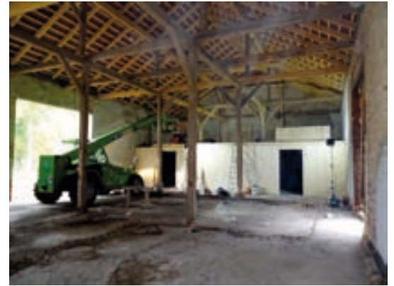
Aufbau Holzkubus aus CLT-Platten