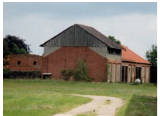
Sichtbare frühere Baustruktur - Aufstockung