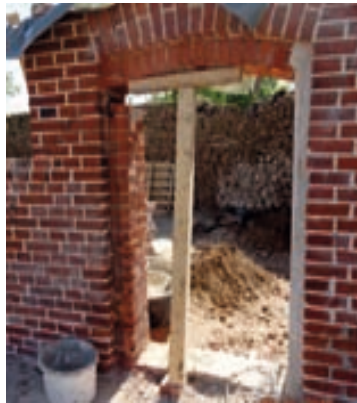
Stall Sicherung Türsturz

Nach der Beräumung folgte die Instandsetzung der alten Außenwände. Das Fachwerk wurde in historischer Art und Weise repariert und in Teilen neu aufgebaut. Dabei wurde das rückgebaute Altmaterial mit verwendet. Viele alte Steine konnten verwendet werden. Die beiden vorhandenen kleinen Keller des ehemaligen Wohnhauses wurden verfüllt. Zugleich wurden die neuen Leitungen im Erdreich verlegt und in beiden Gebäuden die neuen Bodenplatten erstellt.