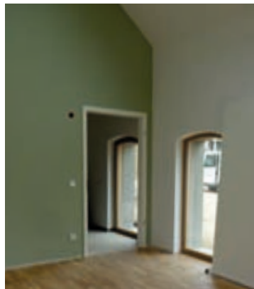
Stall Zimmer 16