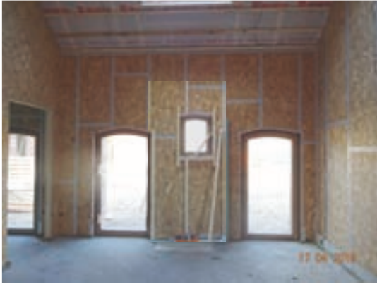
Stall Zimmer 16 Blickrichtung Hof