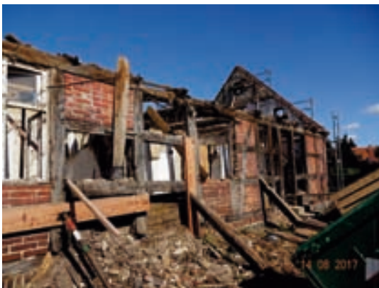
Wohnhaus Sicherung Fassade