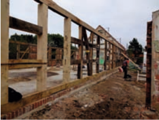
Wohnhaus Reparatur Fachwerk mit Alt+Neusubstanz