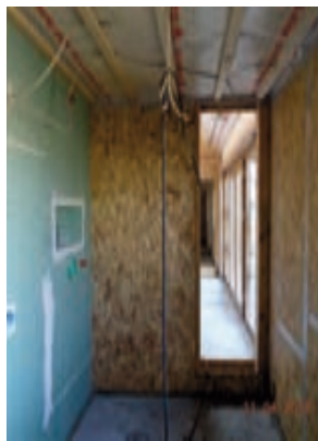
Blick durch die Bäder