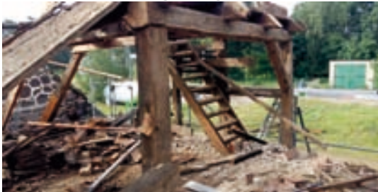
Wohnhaus Rückbau Dachgeschoss