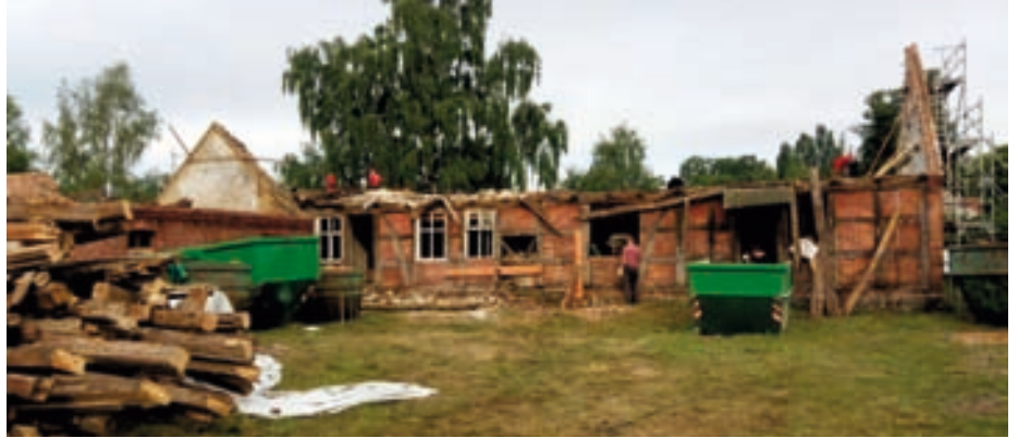
Wohnhaus + Stall rückgebaute Dächer