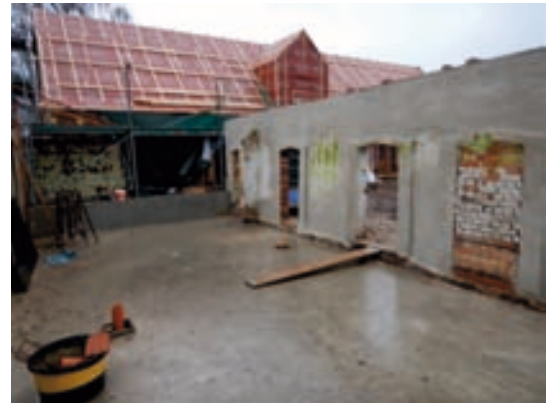
Stall entkernt mit neuer Bodenplatte