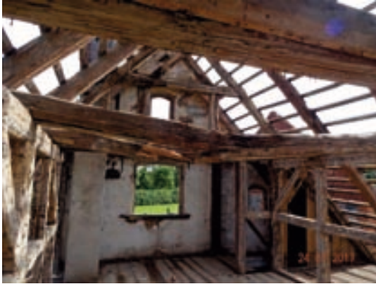
Wohnhaus Entkernung Dachgeschoss