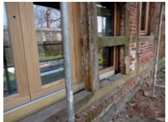
Detail Gemeinschaftsraum Dorfseite