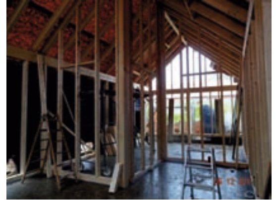
Stall neues Ständerwerk