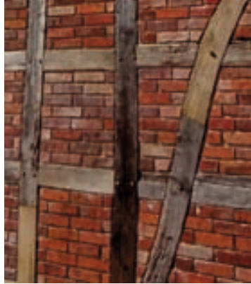
neu ausgemauerte Gefache mit alten Ziegeln