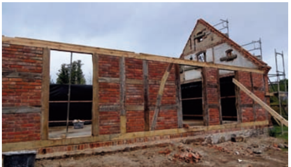
Wohnhaus: wieder aufgebaute Hoffassade