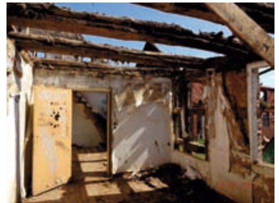
Wohnhaus Entkernung Erdgeschoss

Von Hand und mit großer Vorsicht wurden die Gebäude entschuttet und rückgebaut. Große Mengen Bauschutt kamendabei zusammen. Der regenreiche Sommer machte gerade diese Arbeiten nicht leichter. Zugleich wurden die Außenmauern und Giebel abgestützt, um ein Umkippen zu verhindern. Wieder verwendbare Baumaterialien wie Holzbalken oder Ziegelsteine wurden gesichert und gesäubert. Erst nach dieser Beräumung konnten auch exakte Aufmaße einzelner Bereiche vorgenommen werden. Dies führte auch zu kleineren Umplanungen. So wurde z.B. die Haustechnik statt wie geplant in einem Keller in einem eigens erbauten Technikraum zwischen den Gebäuden untergebracht. Hier findet sich heute die notwendige Technik für die neu errichtete Erd-Wärmepumpen-Anlage, die die Gästezimmer mit Warmwasser und Heizung versorgt.