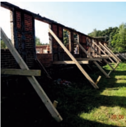
Wohnhaus Bestandsfachwerk gestützt