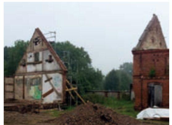
Wohnhaus Giebel freistehend