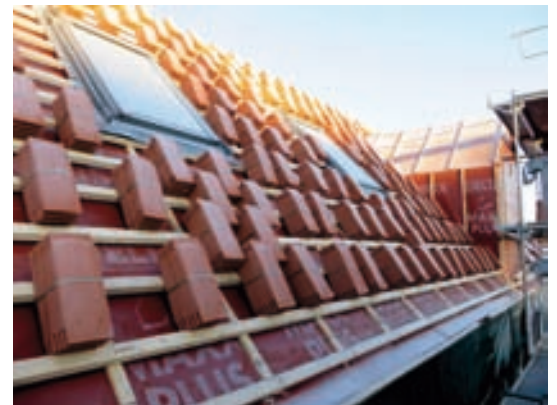
Wohnhaus Verlegung Dachziegel