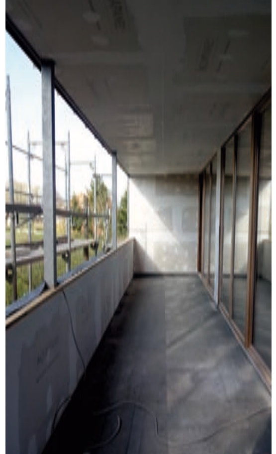
Wohnhaus Balkon noch ohne Trennwände