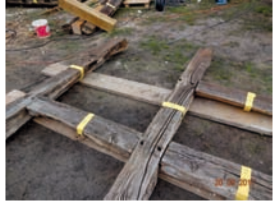
Fachwerk Vorbereitung zum Wiederaufbau