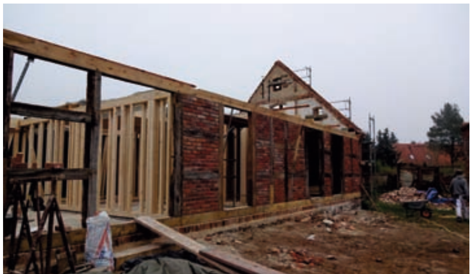
Wohnhaus Hofseite - Stellung der Innenwände

Im nächsten Schritt wurden jeweils die neuen Gebäude in die alten Hüllen eingestellt. Diese sind gänzlich in Holzbauweise errichtet und stellen auch faktisch eigenständige Gebäude dar. Sie sind mittels eines Luftraums von den alten Mauern getrennt. Alle neuen Elemente wie z.B. Fenster finden sich in dieser neuen Ebene. Die Altsubstanz ist somit quasi eine vorgestellte Fassade.