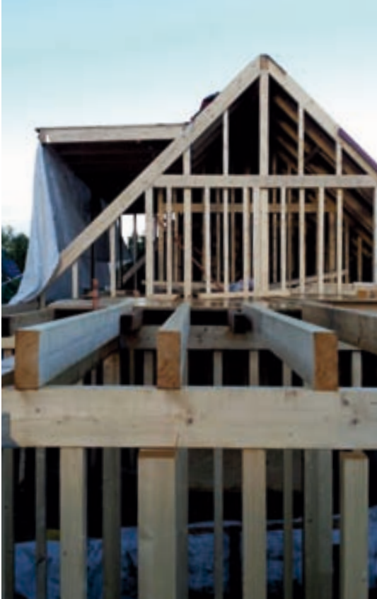
Wohnhaus neue Holzständerwand