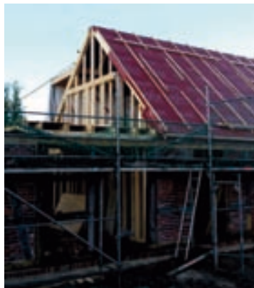
Wohnhaus Bestand / Ständerwerk