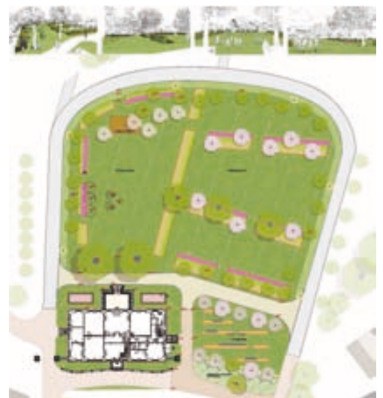
Final ausgeführte Planung