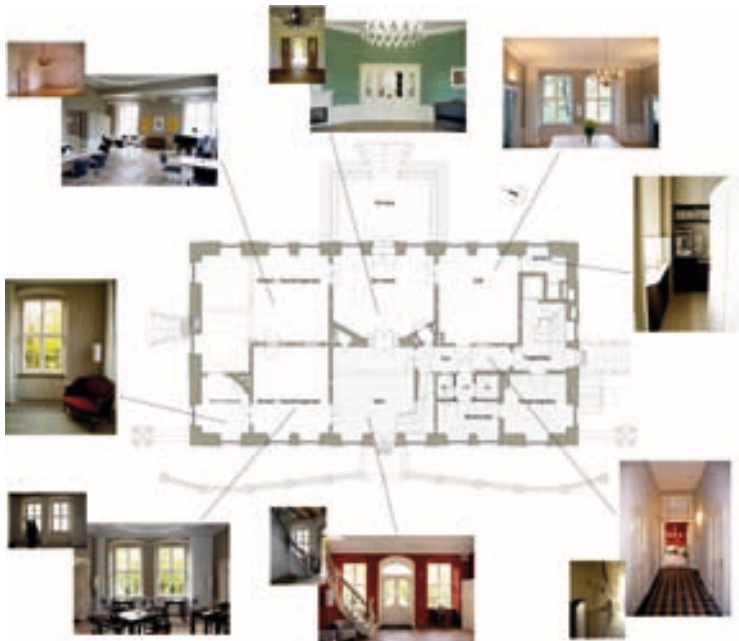
Grundriss Erdgeschoss mit Raumdetails 2007/2009

Das Erdgeschoss ist der zentrale und öffentliche Teil des Hauses. Die Räumlichkeiten lassen sich neben dem Café- und Restaurantbetrieb u.a. für Ausstellungen, Konzerte und Tagungen nutzen. Neben historischer Substanz findet sich im Schloss Grube moderne Technik. Die Beheizung erfolgt über Wandflächenheizungen, die Wärmeerzeugung über eine Luft-Wärmepumpe. Es wurden sowohl ein Personalausgang als auch ein Speisenaufzug eingebaut.