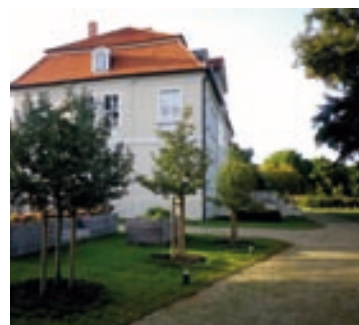
Blick über neue Apfelbäume