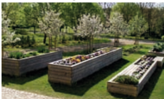
Nutzgarten zum riechen und kosten

Nur die alten Linden verweisen auf die Zeit vor der Parzellierung des Gartens. Eine historische Gestaltung ist nicht überliefert. Im Rahmen eines Wettbewerbs wurde 2013 eine Lösung umgesetzt, bei der klassische Gartenelemente in moderner Gestaltung eine angemessene Lösung für die besondere Lage des Gartens schaffen.