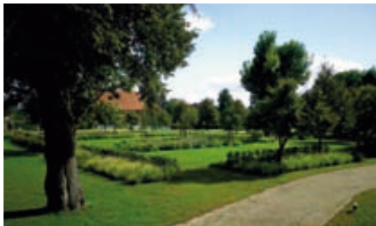
Wiesenelemente und gliedernde Hecken

Nur die alten Linden verweisen auf die Zeit vor der Parzellierung des Gartens. Eine historische Gestaltung ist nicht überliefert. Im Rahmen eines Wettbewerbs wurde 2013 eine Lösung umgesetzt, bei der klassische Gartenelemente in moderner Gestaltung eine angemessene Lösung für die besondere Lage des Gartens schaffen.