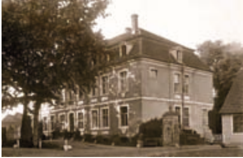
Historische Ansicht nach 1910