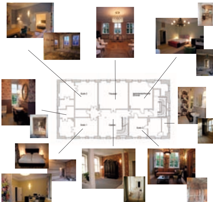
Grundriss Obergeschoss mit Raumdetails 2010/2011

Heute befinden sich im Obergeschoss drei Suiten und ein behindertenfreundliches Gästezimmer. Die großzügigen Raumdimensionen ergeben sich aus dem historischen Grundriss. Der in der Mittelachse befindliche Saal wurde mit einem Tafelparkett aus bauzeitlichen Dielen ausgestattet. Die anderen Zimmer verfügen historisch korrekt über Dielen. Im behindertenfreundlichen Gästezimmer befinden sich die einzigen aufgefundenen historischen Wandgestaltungen in dieser Etage. Die Reste einer Supraporte sind als historisches Sichtfenster erlebbar.